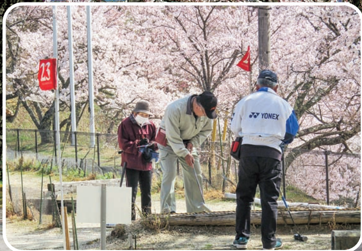
桜満開のコミュニティの森でマレットゴルフ (3/31)