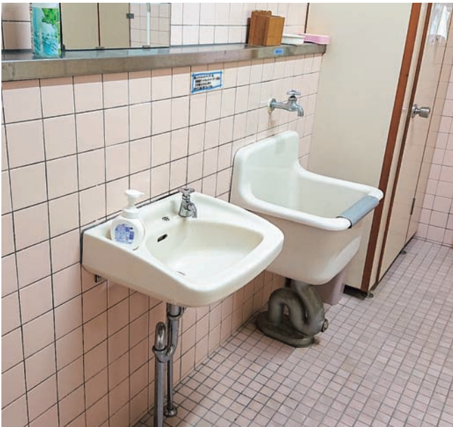
町内主要な施設(学校・保育園)の水道蛇口の自動水栓化を