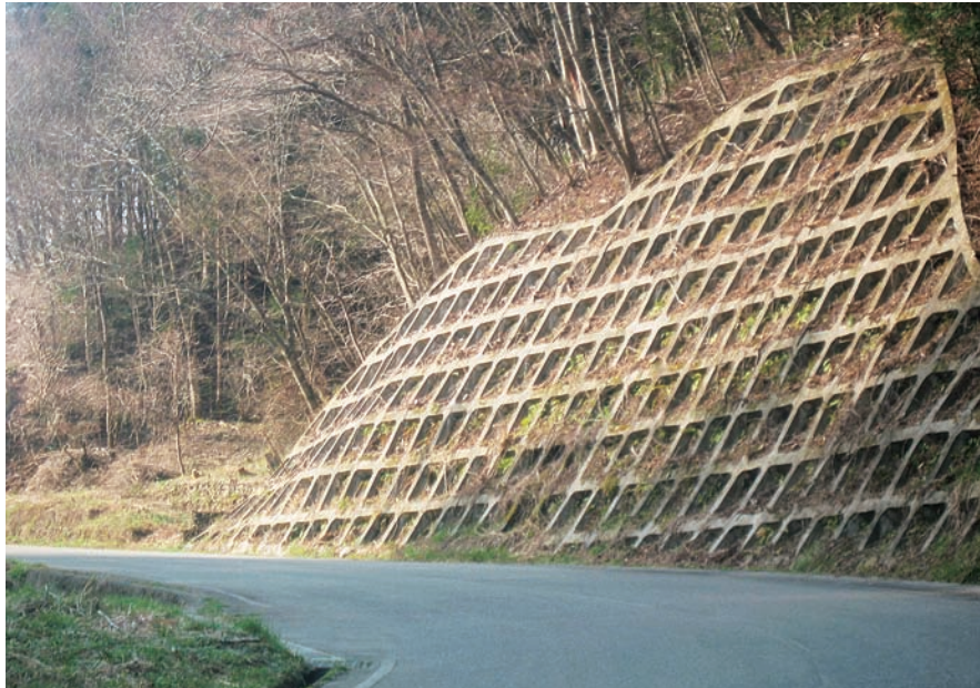
景観整備された町道大下条 59 号