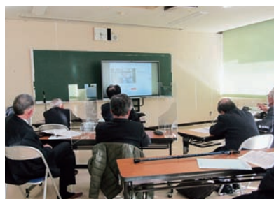
オンラインによる研修