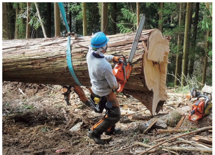
林業従事者に支援を