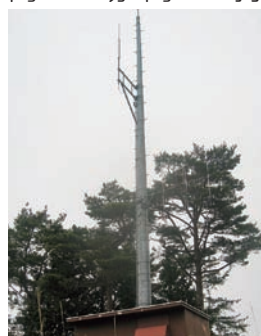
更新される防災行政無線(弁当山中継地)