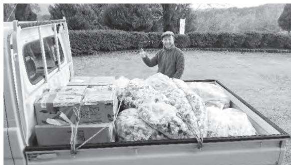
↑たくさん集まったペットボトルキャップ