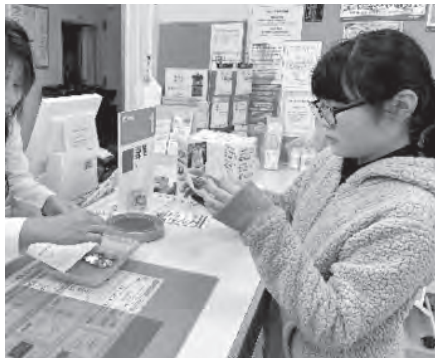
↑富草小児童会が代表して振り込みました

6月から12月までの半年間、各学校で地域の方に呼びかけて回収したところ、4校で集まったペットボトルキャップは253kg。集めたお金は2,530円。20円で一人分のワクチンが買えるので、約126人分のワクチンを寄付したことになります。地域の皆様、ご協力ありがとうございました。