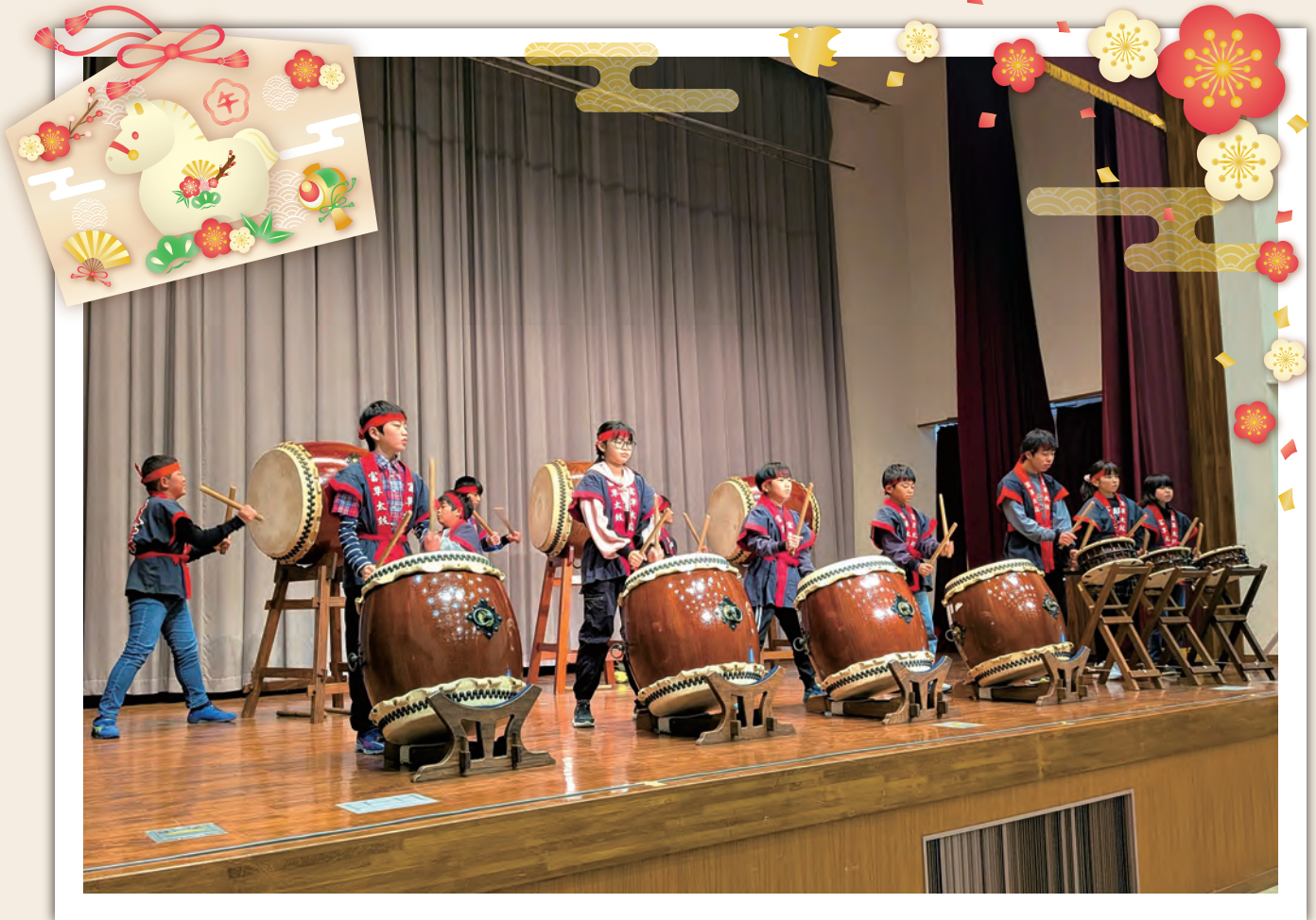
第39回 感性と創造のフェスティバル 富草小学校6年生「富草太鼓」