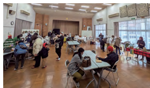
12月13日(土) 感性と創造のフェスティバルマーケット