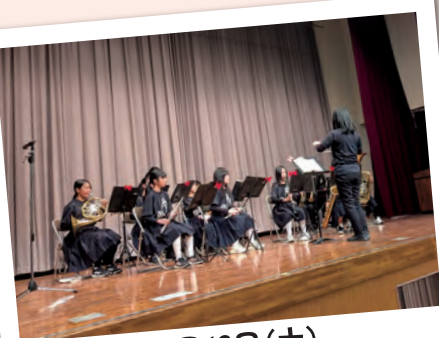
12月13日(土) 感性と創造のフェスティバル