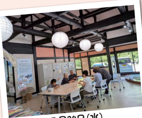
7月30日(水) 水引ワークショップ