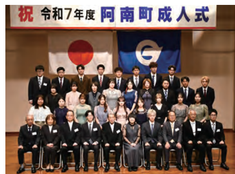
8月15日(金) 令和7年度 成人式