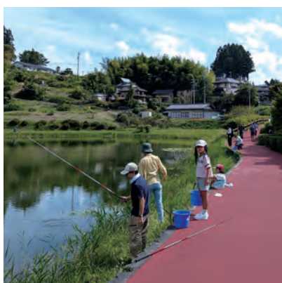
9月28日(日) 深見の池釣り大会&SUP体験!