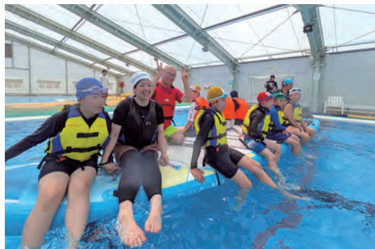
7月12日(土) エンジョイスクエアin阿南町