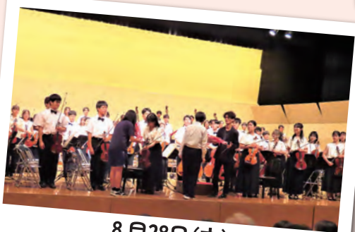
8月28日(木) 京都大学旅行演奏会2025in下條村