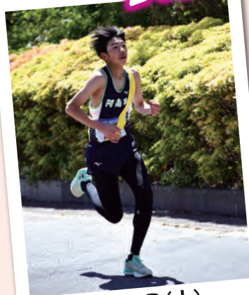
4月26日(土) 第34回市町村対抗駅伝