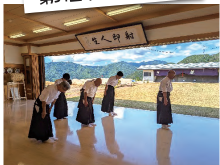
7月27日(日) 愛知・長野県境域スポーツ交流会