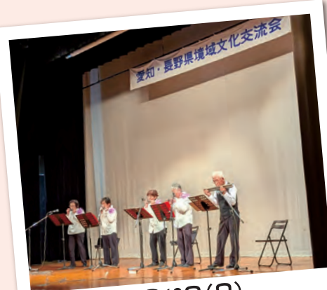
10月19日(日) 愛知・長野県境域文化交流会in豊根村