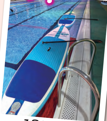
7月18日(金) B&Gナイトプール