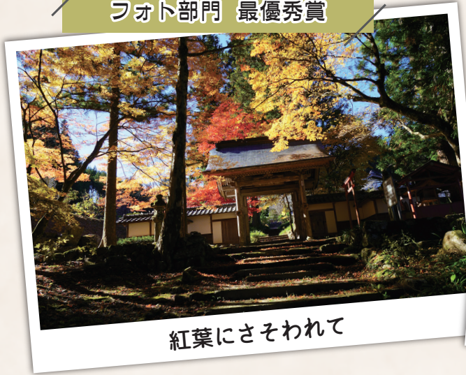
紅葉にさそわれて