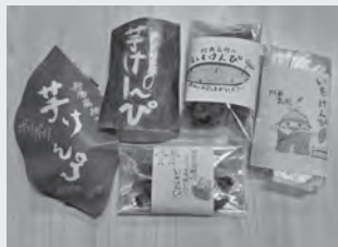
パッケージ制作の様子