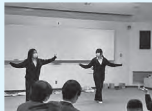
図書委員会主催 クリスマス会