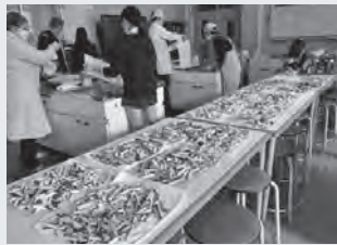
芋けんぴ作りの様子