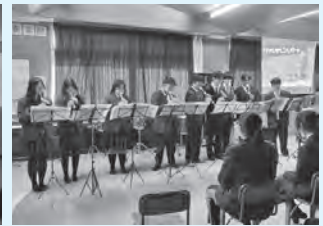
3年 音楽選択者による発表