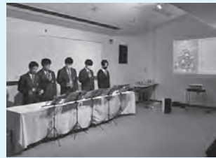
1年 ハンドベルコンサート

毎年この時期は、各授業や委員会主催のクリスマスイベントが開催されます。今年も音楽の授業や図書委員会によるクリスマスイベントが行われました。どの催しも、これまでの成果や準備が感じられるもので、参加した生徒もリラックスした様子でひとときを楽しんでいました。