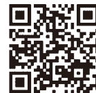
認証キーの取得方法 発注者への提出方法